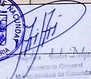
Secretaria General Municipalidad de Ñacunday